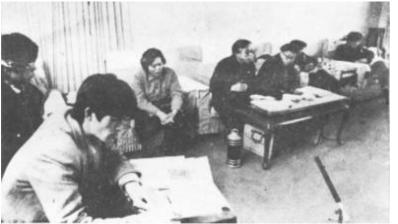
出席市政协二届二次会议的委员们认真讨论市政协常委会工作报告 结合实际 积极为振兴东营献计献策。

社会商品零售总额12亿元，增长2.3%；市场零售物价指数上升幅度低于去年；出口商品收购总值9574万元，力争达到1.20亿元，增长8.8%；人口自然增长率控制在9.8%。