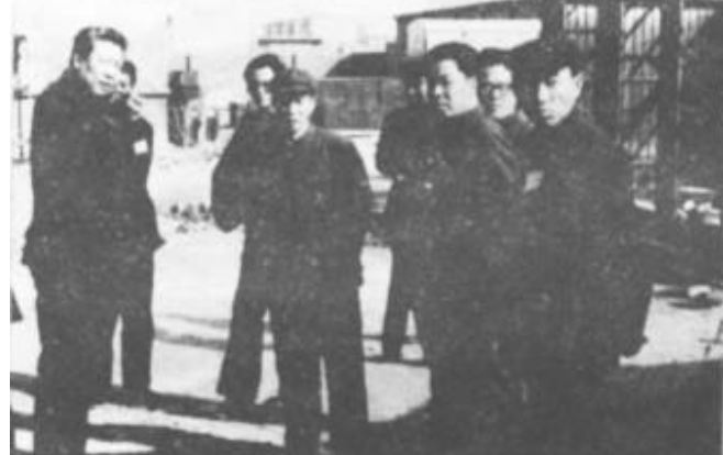
△ 3月10日下午，出席市政协二届二次会议的农林界委员参观了省1988年乡镇企业先进村——辛店村玻璃钢厂。委员们对该厂的工作给予了高度评价。

20%。第三，继续清理整顿公司。第四，建立健全市场物价管理体系，严格物价管理权限，坚决制止乱涨价、哄抬物价。经营单位对商品一律明码标价，自觉接受监督检查。要强化财税、物价纪律，继续搞好物价、财税大检查，确保全市今年的物价上涨幅度明显低于去年。切实加强市场管理，严厉打击不法行为，保护合法经营，确保有一个良好的流通秩序。第五，在治理整顿中，要把着眼点放到产业结构调整上。